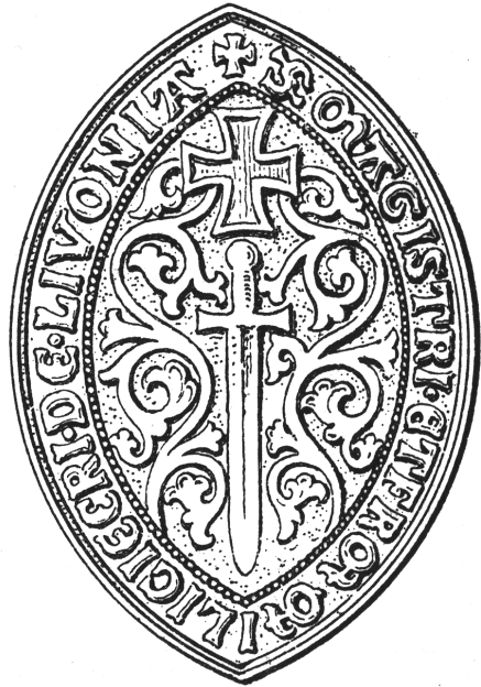
Mõõgavendade ordumeistri pitsar.

kui ka ilmalik võimkond, mistõttu võib Albertit pidada Põhja-Saksa vaimulike ja alamaadlike koloniaalse ekspansiooni poliitika elluvijaks. Kolmandik vallutatud aladest läks ordule, millega tekkis võimalus luua ristsõdijate riik esimest korda ka väljaspool Palestiinat.