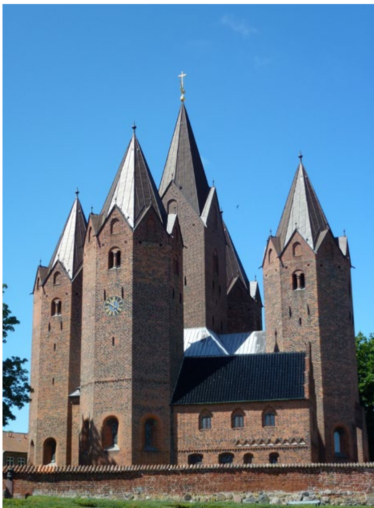
JOONIS 1.10. Kalundborgi Maarja kirik.

sümboolselt Kristuse hauakirikut Jeruusalemmas. Paar kilomeetrit eemal ehitas tema võitluskaaslane Peder – naise kaudu Hvide – samasuguse oma linnusesse. Tõenäoliselt on Sunega seotud ka Püha Risti ümarkiriku püstitamine Selsø mõisa Roskilde fjordis, sest tema lapselapselaps oli kiriku omanik veel rohkem kui sajand hiljem.