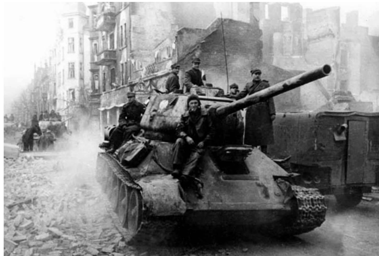
Nõukogude Liidu ja Poola väed sisenevad tankidel T-34 Berliini, mai 1945. Sõja lõpp ... ja uue vastasseisu algus.

See oli delikaatne viis öelda, et pärast operatsiooni Barbarossa esialgset edu ja punavägede aastatepikkust sõjategevust oli Nõukogude Liidu lääneosa üsna laastatud. Pärast aastaid kestnud hävitustööd ja purustusi oli