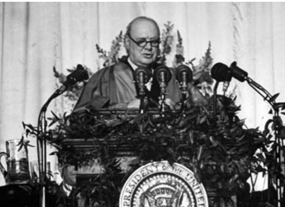
Churchilli nn raudse eesriide kõnega seati paika uus reaalsus selle tumedaimates toonides.

tuleks meil arvata Staabiülemate Komitee enesekindlusest selliste oletuste tegemisel, et „ettevõtmisel on nii Briti impeeriumi kui ka Ameerika Ühendriikide avalikkuse täielik toetus ja seega on Briti ja Ameerika sõdurite võitlustahe endistviisi tugev“? Pärast kuut aastat kestnud Teist maailmasõda haaraks lääne ühiskond kinni võimalusest hakata pidama kolmandat maailmasõda – see oletus oli ilmselgelt üle pakutud.