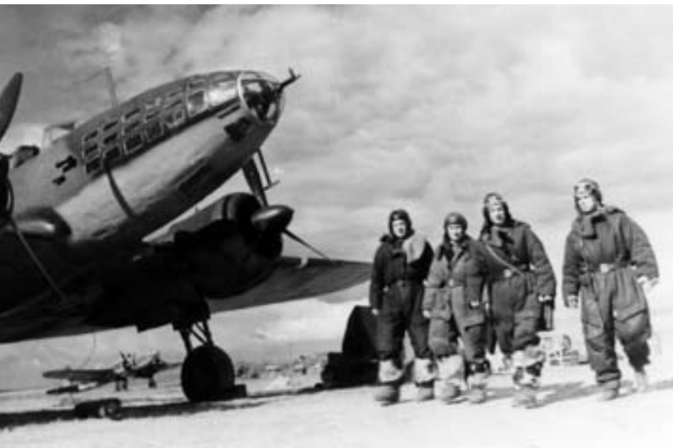
Nõukogude lennusalgal on missioon lõppenud. Kas nüüd seisib ees sõda Läänega?

„Sõda Venemaa ja demokraatlike riikide vahel läheneb ja tegelikult on see juba alanud ning Saksamaal palutakse selles osaleda.“