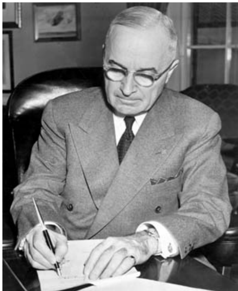
Harry S. Trumanil tuli oma ametiajal nii mõndagi õppida.

Lääne propagandasin oli sõja ajal andnud endast parima, et näidata liitu sovettidega soodsas valguses, kuid keegi ei hellitanud suuri lootusi, sest nende suhe oli alati olnud pigem mugavusabielu. Ideoloogiline veelahe natside ja Nõukogude kommunistide vahel oli kahtlemata tohutult suur, kuid ega kahe totalitaarse režiimi vahel suurt valikuvõimalust olnud. Hitler oli kujutanud endast vahetut ohtu – seega oli teatav üksteisemõistmine Nõukogude Liiduga olnud hädasti vajalik, ent see ei vähendanud mingilgi määral ohtu, mida kujutas nüüd NSV Liit ise.